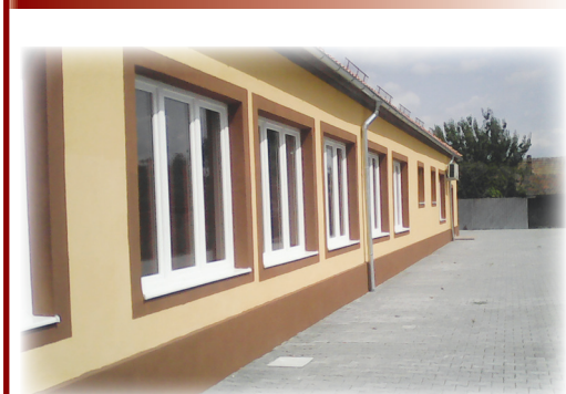
Școala noastră în „haine noi”